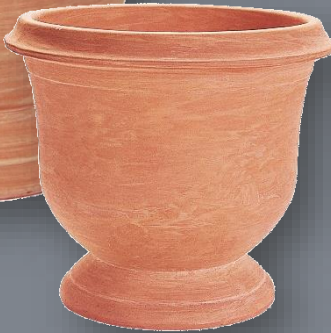
Modèle Jarre Gauloise